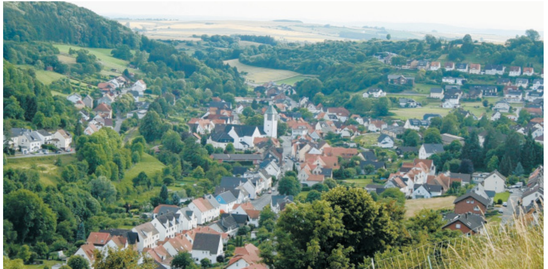
Herrlich gelegen: Es ist eigentlich egal, auf welchem Berg der Betrachter steigt. Von allen Seiten macht Dalhausen eine gute Figur. Im Zentrum des Dorfes ist die St. Marienkirche zu sehen. Dort haben sich zu Beginn auch die ersten Häuser angesiedelt.

Urental 15 37688 Beverungen Dalhausen fon 05645-1817 fax 05645-74522